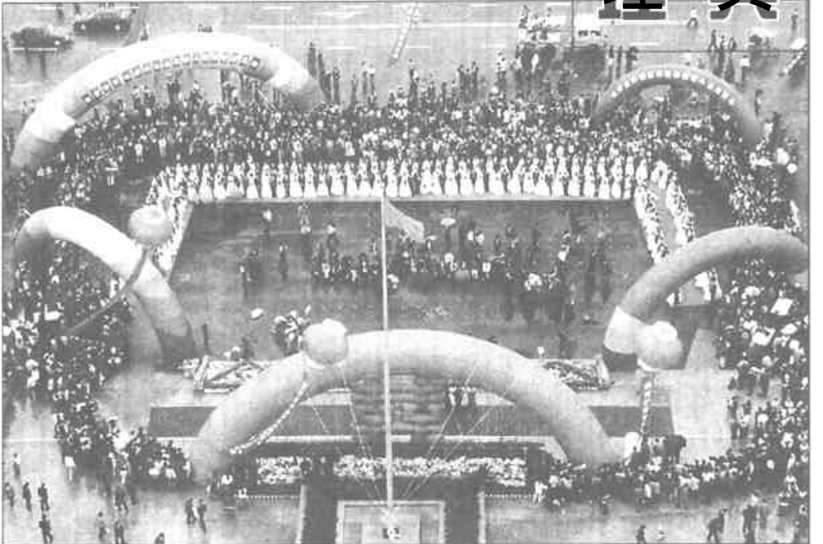
图为世纪婚礼大典现场。

做到一个片一个品种，在科学种植上实现新突破，实施科学配种，科学施肥的面积占总面积的95%，实现机械化作业面积占总面积的98%以上，种子包衣和药剂拌种技术推广面积100%。(本报通讯员)