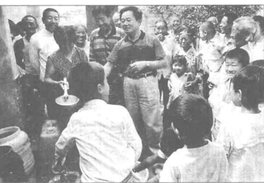
“来水啦！”东营区油郭乡张营、郑营、赵家3个村子的6300口人喝上了洁净的自来水，至此，全县31个村全部通上了自来水，村民们结束了吃坑塘水的历史。今年以来，该县投入70多万元新上输水主管线和对村庄原有管线进行改造，其中18个村达到了小康用水标准。

汲取近年来水产品集中上市、群众卖鱼难的教训，利津县及早采取四项有力措施，做好水产品的促销工作。一是早宣传，充分利用报刊、广播、电视、因特网等媒介，提前2个月，在东营电视台、省《海洋与水产信息》、政府信息网上发布销售信息、广告；二是早建市，在淡水养殖重点乡镇汀罗镇兴建了1处水产品批发市场，全县其他农贸市场及集市、鱼市的秩序及环境也得以优化和改善；三是早落实责任，各乡镇及县直有关部门转变政府职能，由“官逼民富”切实转到“逼官富民”的思路上来，各级各部门落实水产品促销责任制，定人员、定任务、包池包户，帮助养殖户搞好销售；四是早销售，改单一规格集中上市为多规格分散上市，组织养殖户早上市、小规格销售。（顾国岭 董立峰 凤珍）